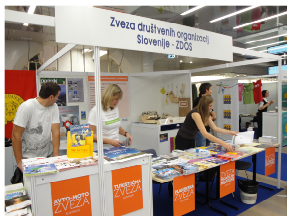
Stojnica ZDOS na F3ŽO.

Med 27. in 29. septembrom 2011 se je v Cankarjevem domu v Ljubljani odvijal že 11. Festival za tretje življenjsko obdobje (F3ŽO). Cankarjev dom je odprl vrata medgeneracijskemu sožitju, ustvarjalnosti in izmenjavi idej. Časovno in vsebinsko se festival navezuje na 1. oktober, ki je Mednarodni dan starejših, ter na 3. oktober, ki je Mednarodni dan otroka, rdeča nit festivala pa je bila letos posvečena Evropskemu letu prostovoljstva.